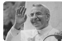
Beato Giovanni Paolo I, papa

Abitazione e ufficio parrocchiale: 0437 590280 Don Vito personale: 339 67 35 920 Museo Albino Luciani: 0437 19 48 001