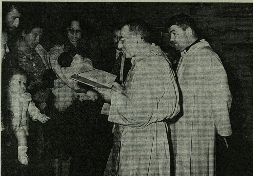
3 LUGLIO: CELEBRAZIONE COMUNITARIA DEL BATTESIMO PRESIDUTA DAL CARD. LUCIANI - PATRIARCA DI VENEZIA.

Qui è l'inizio della cerimonia, quando il celebrante dice: «Cari genitori, chiedendo il Battesimo per i vostri figli, voi vi impegnate a educarli nella fede, perchè nell'osservanza dei comandamenti, imparino ad amare Dio e il prossimo, come Cristo ci ha insegnato».