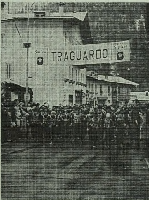
Partenza della gara podistica.