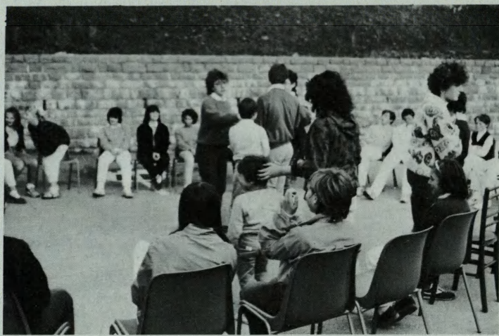
ACR. Festa del Ciao (12 ottobre 86).

Mai i due autori improvvisati avrebbero immaginato tanto successo: l'eco di Stile Nacht giunse oltre Oberndorf, oltre Hallein, oltre il Tirolo, oltre l'Austria, oltre Europa, oltre Oceano... E ancora risona.