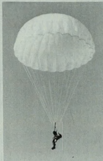
E' uno dei nostri alla scuola militare paracadutisti di Pisa. Ma chi sarà?

È risorto per pochi. La pietra rovesciata davanti al suo sepolcro venti secoli fa, divide ancora l'umanità in credenti e increduli, in ottimisti e disperati. Qual è il nostro posto? La nostra scelta?