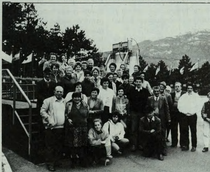
Domenica 26 ottobre il pellegrinaggio alla Madonna di Piné (TN) e poi una visita al campanone dei caduti di Rovereto.

Dopo la visita alle famiglie, penso che il modo migliore di ringraziare i miei parrocchiani sia quello di ricordarli al Signore nella mia preghiera. Perché sono certo che è Dio la vera ricompensa di ogni sacrificio e di ogni azione che noi facciamo per amore.